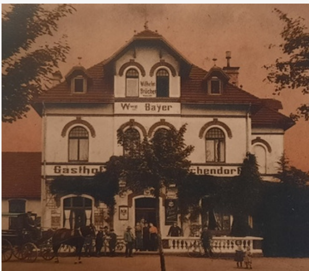
Veranstalterin: Verein für Geschichte und Heimatkunde Quadrath-Ichendorf 1985 e.V.

Eingängige Keyboardsoli und verquere Bass- und Gitarrenläufe mischen sich mit schnellen Snare Drum Wirbeln und deutschen Texten, die zwischen nachdenklich und wütend driften. Um den Stil von Stereokult zu packen und in Kategorien zu stopfen, tauchen indes neue Einflüsse auf und alle streben sie in andere Richtungen: laut und leise, harmonisch und anarchisch, aufgeregt und abgeklärt.“ (Uli Kreikebaum - Kölner Stadt-Anzeiger