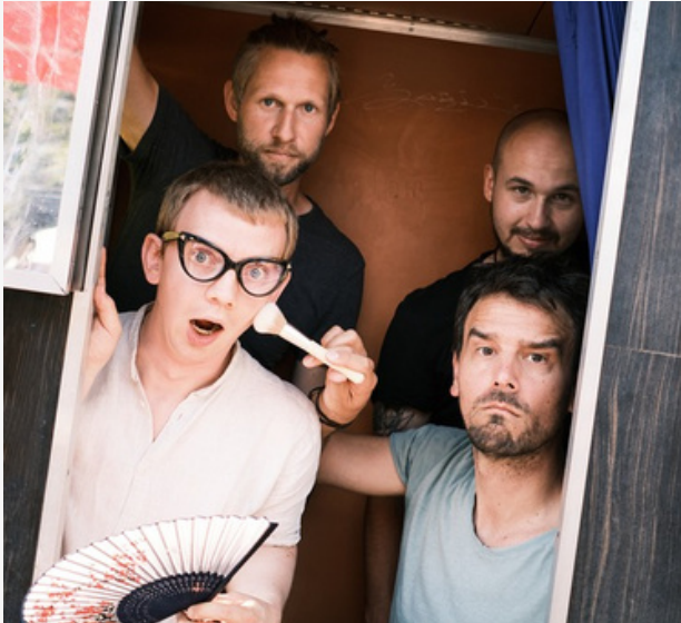
Veranstalter: EG BM